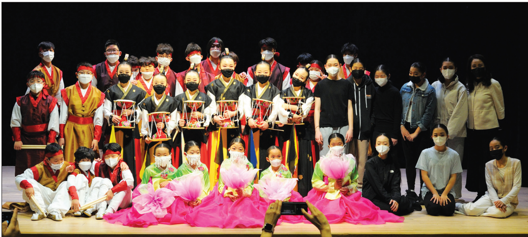
남부뉴저지통합한국학교는 3월 27일 뉴저지 글래스보로 소재 보이드리사이틀 홀(Boyd Recital Hall)에서 로완대학교가 주최하는 Asian Extravaganza에서 '한국의 멋(Beauty of Korea)'이라는 주제로 문화예술공연을 펼쳤다